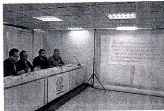
18 DE OCTUBRE: TRANSPARENCIA Y RENDICIÓN PUNTUAL A LOS SERVIDORES.