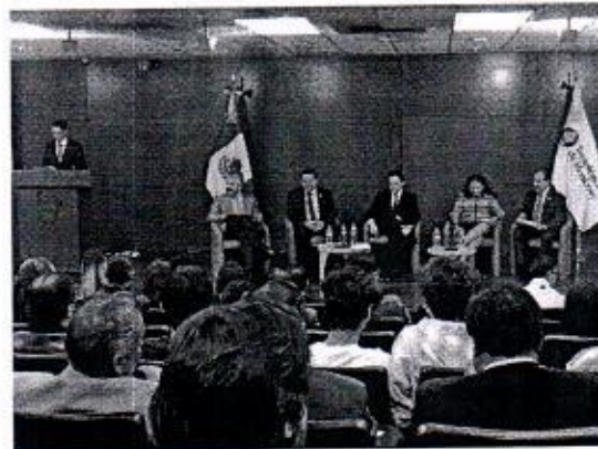
23 DE FEBRERO: FORO "REFORMA POLÍTICA" EN EL TEC MTY CAMPUS CDMX.