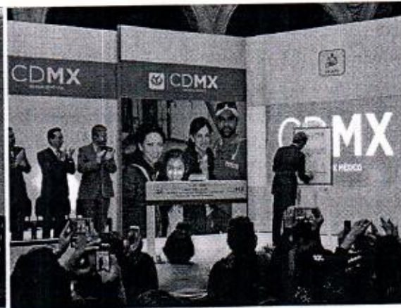
18 DE ENERO: EVENTO CON EL JEFE DE GOBIERNO, FIRMA Y PUBLICACION DE INSTRUMENTOS QUE CONDONAN Y SUBSIDIAN EL PAGO DEL IMPUESTO PREDIAL.