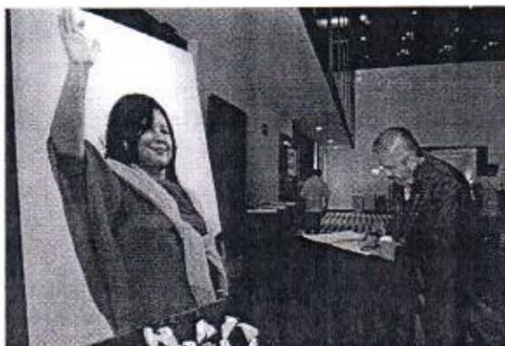
09 DE ENERO: HOMENAJE POSTUMO EN HONOR DE GISELA MOTA.