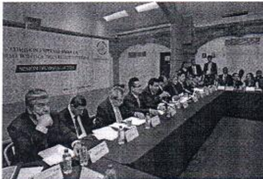
04 DE NOVIEMBRE: INSTALACIÓN DE LA COMISIÓN ESPECIAL PARA LA REFORMA POLÍTICA.