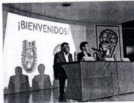
26 DE FEBRERO: CONFERENCIA "REFORMA POLÍTICA DE LA CIUDAD DE MÉXICO" EN LA ESCA- TEPEPAN DEL IPN.