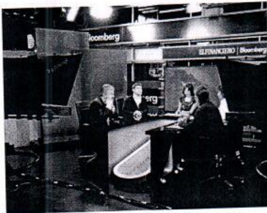
11 DE ENERO: PARTICIPACIÓN EN NOTICIERON FINANCIERO BLOOMBERG.