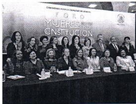
24 DE FEBRERO: INAUGURACION DEL FORO MUJERES EN LA CONSTITUCION DE LA CIUDAD DE MEXICO.