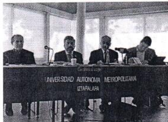
11 DE FEBRERO: CONFERENCIA EN UAM IZTAPALAPA "REFORMA POLÍTICA DE LA CDMX".