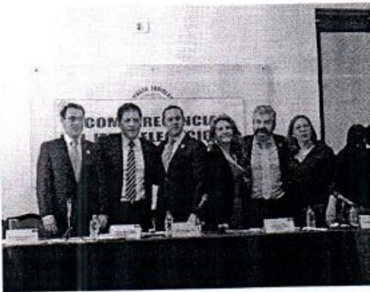
25 DE FEBRERO: COMPARECENCIA DEL JEFE DELEGACIONAL EN GUSTAVO A. MADERO.