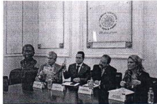
05 DE NOVIEMBRE: CONFERENCIA DEL PROGRAMA MÉDICO EN TU CASA.