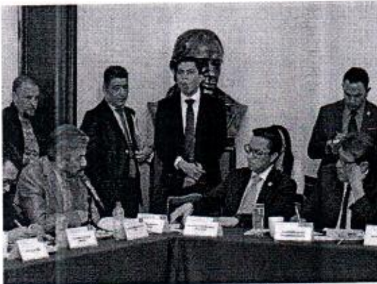
23 DE FEBRERO: PARTICIPACIÓN EN LA COMPARECENCIA DEL JEFE DELEGACIONAL EN CUAUHTÉMOC.