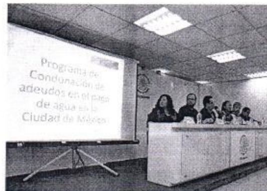
24 DE ENERO: CONFERENCIA DE PRENSA SOBRE CONDONACION DE ADEUDO POR SERVICIO DE AGUA.