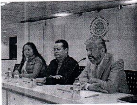
17 DE ENERO: CONFERENCIA DE PRENSA CONJUNTA SOBRE CAMPAÑA DE DIFUSIÓN DE REFORMA POLITICA A CIUDADANÍA