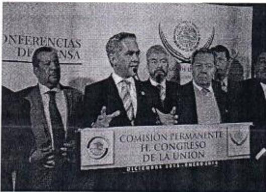
20 DE ENERO: DECLARACIÓN DE CONSTITUCIONALIDAD DE LA REFORMA POLITICA DE LA CIUDAD DE MEXICO.