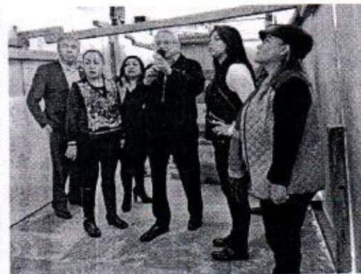
22 DE DICIEMBRE: RECORRIDO POR LINEA 2