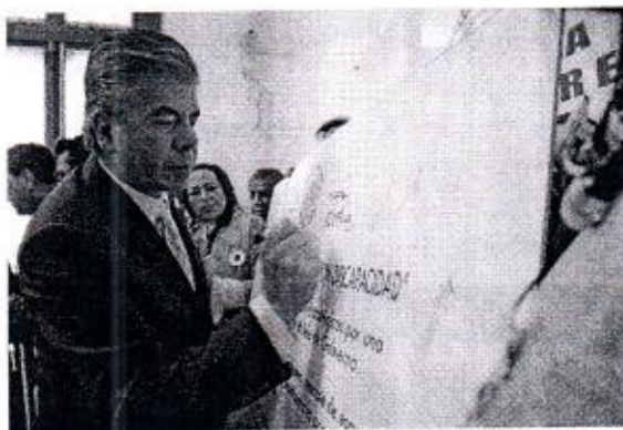
03 DE DICIEMBRE: FIRMA DE ACUERDO EN FAVOR DE PERSONAS CON DISCAPACIDAD.