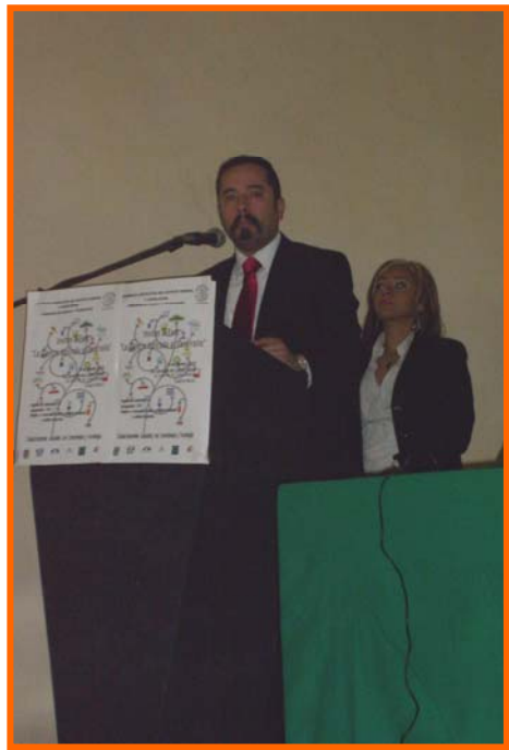
INTERVENCIÓN DEL DIP. VÍCTOR HUGO ROMO GUERRA DURANTE LA INAUGURACIÓN DEL FORO "LA CIENCIA APLICADA AL DESARROLLO"