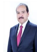
DIP. ENCARNACIÓN ALFARO CÁZARES