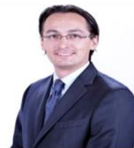
DIP. ANDRÉS ATAYDE RUBIOLO