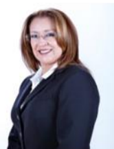
DIP. ELENA EDITH SEGURA TREJO