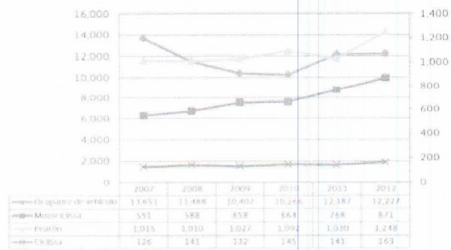
Accidentes por tipo de usuario, 2007 a 2012