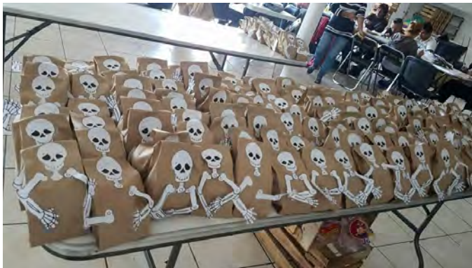
“En la CDMX lo primordial es la alimentación”