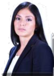
DIP. LOURDES VALDEZ CUEVAS PRESIDENTA