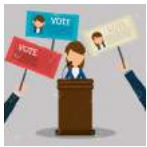
CANDIDATO SIN PARTIDO

SE FORTALECEN LAS ATRIBUCIONES DEL INSTITUTO ELECTORAL DE LA CIUDAD DE MÉXICO, EN EL ÁMBITO DE LAS NUEVAS FIGURAS DE DEMOCRACIA DIRECTA Y PARTICIPATIVA.