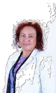
DIP. ABRIL YANNETTE TRUJILLO VÁZQUEZ PRESIDENTE