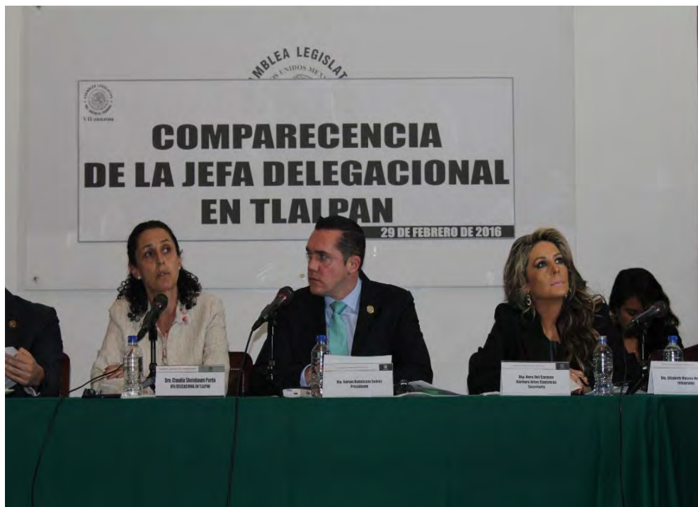
Comparecencia del Jefe Delegacional en Tlalpan , 29 de febrero