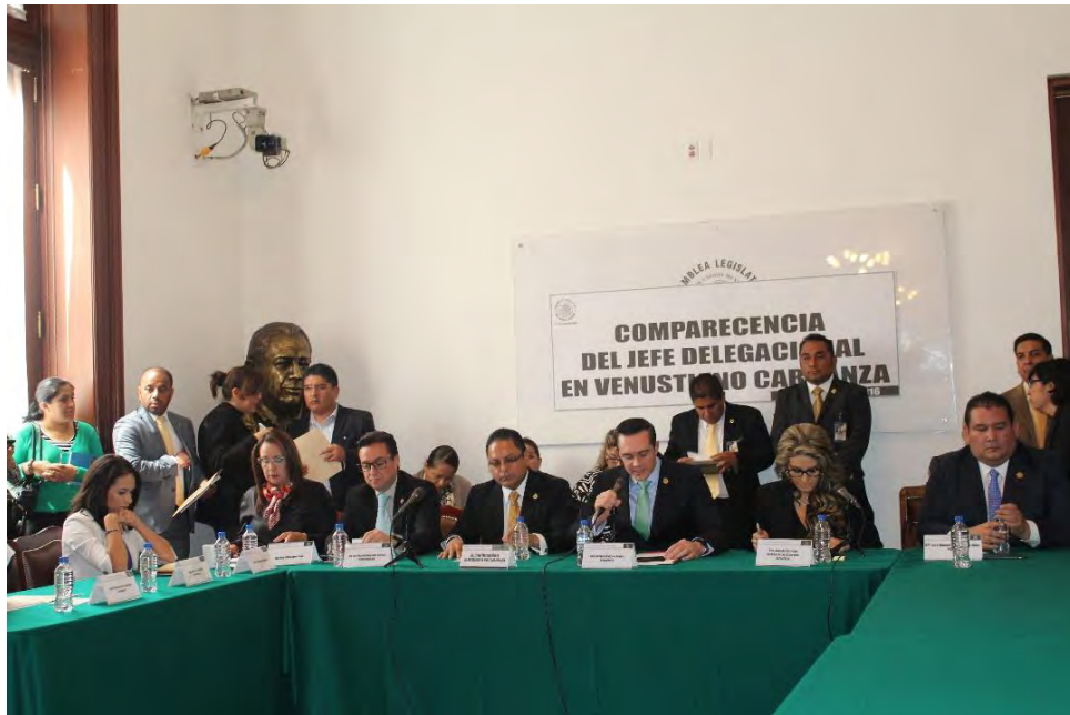
Comparecencia del Jefe Delegacional en Venustiano Carranza , 1 de marzo