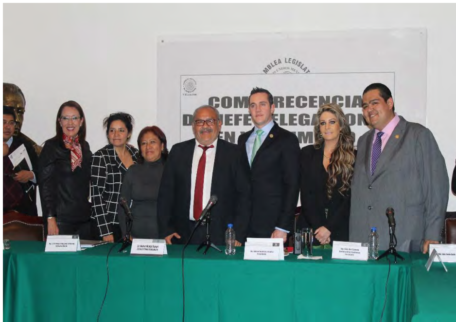
Comparecencia del Jefe Delegacional en Xochimilco , 1 de marzo