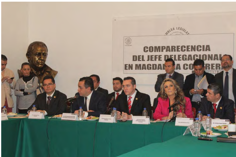
Comparecencia del Jefe Delegacional en Magdalena Contreras , 26 de febrero