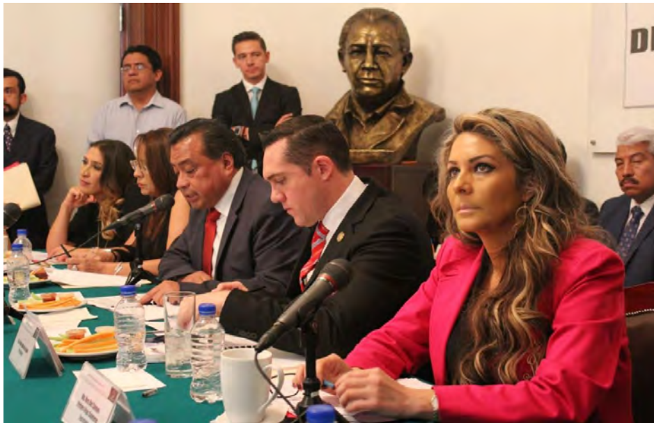
Comparecencia del Jefe Delegacional en Milpa Alta , 26 de febrero