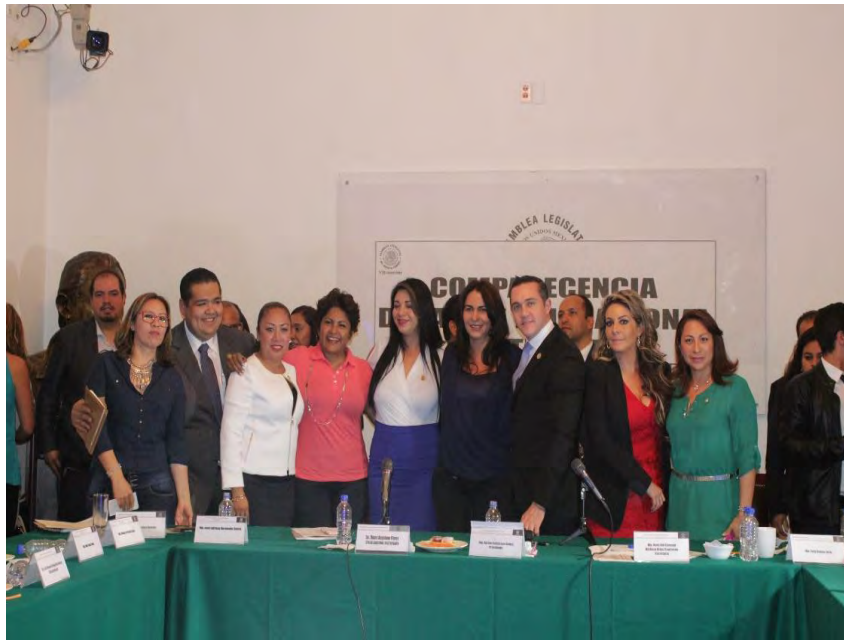
Comparecencia de la Jefa Delegacional en Iztapalapa , 25 de febrero