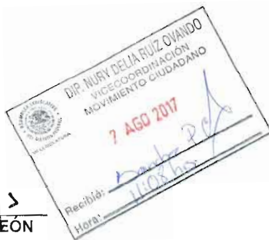
DIP. REBECA PERALTA LEÓN PRESIDENTA