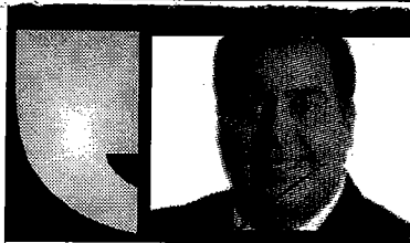
TONATÍUH GONZÁLEZ CASE*