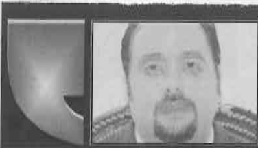
DIP. TONATIUH GONZÁLEZ CASE