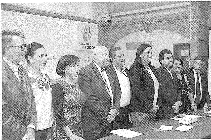
DURANTE LA reunión de los integrantes de la Comisión de Gobierno de la ALDF con legisladores de Morena, se aseguró que no se privilegiará a nadie.

Asimismo, anticipó que se habló del formato que podría contemplar en el informe del ejecutivo local, Miguel Ángel Mancera, el 17 de septiembre, el cual se dará a modo de debate con preguntas y respuestas.