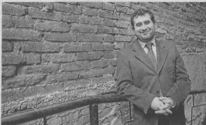
César Cravioto Romero

mos permitidos y los remiten al Ministerio Público como presuntos narcomenudistas. ¿Será cierta la denuncia del grupo de la sociedad civil, don Hiram?