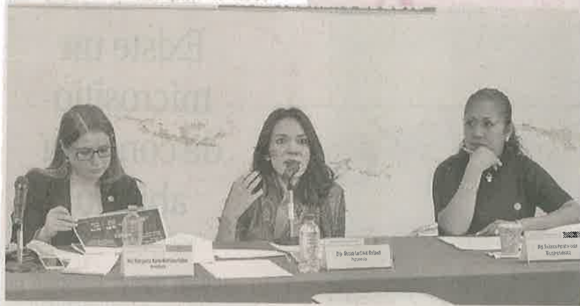
DUNIA LUDLOW presidenta de la Comisión de Vivienda de la ALDF.

Sin embargo, reconoció que aunque habrá colonias donde no se contemple la construcción de vivienda económica, dijo que no debe fomentarse la desigualdad entre los capitalinos, ni restringirse la construcción de vivienda popular en zonas específicas.