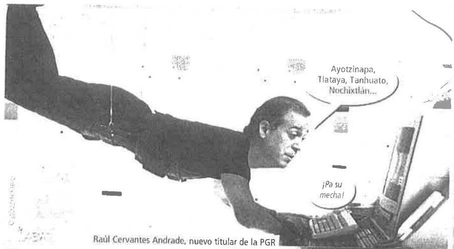
Raúl Cervantes Andrade, nuevo titular de la PGR