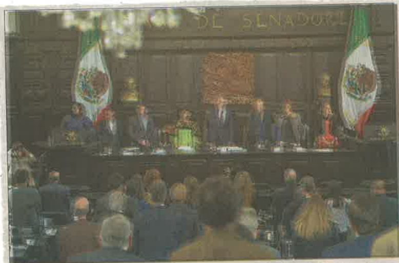
El 31 de enero, la Asamblea de la Ciudad de México deberá presentar la nueva Constitución que regirá administrativa y políticamente a esta entidad del país.

ticipativa, justa, incluyente y próspera, donde se ejercen las garantías civiles y sociales con libertad, sin condicionamientos ni discriminación". En su opinión, la Constitución debería tener "como articulador de toda política pública, la promoción y respeto a los derechos humanos de todas y todos los habitantes de la ciudad".