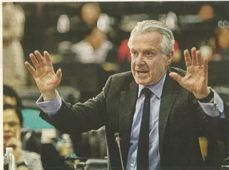
LÍDER. Santiago Creel Miranda, coordinador parlamentario del PAN en la Asamblea Constituyente.

Señaló que la participación del PAN en la Constituyente ha sido determinante porque están proyectando un sentido de humanismo en sus principios. El reto, indicó, es fortalecer el bien común que empieza con la dignidad del ser humano. Los panistas, agregó, están impulsando propuestas tan como una auténtica democratización del poder hacia las alcaldías, los cabildos, la participación ciudadana, a través del plebiscito, el referéndum, y la consulta popular.