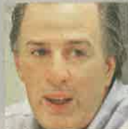
Jose Antonio Meade