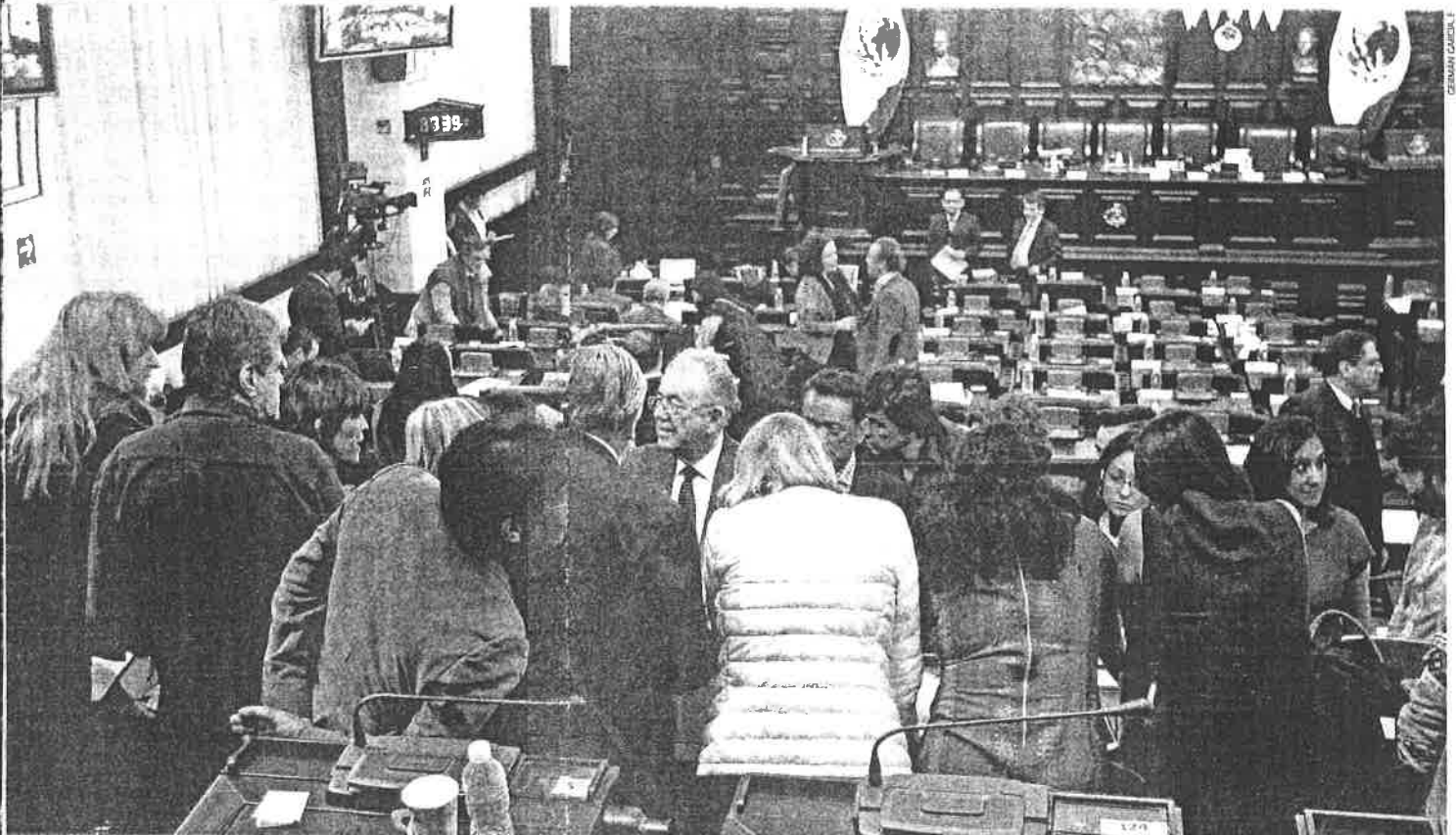
Alejandro Encinas, presidente de la Mesa Directiva de la Asamblea Constituyente, asegura que aunque se han votado 20 artículos, algunos son de los más extensos y hay un 33% de avance sobre los temas polémicos.

Jaime Cárdenas, diputado de Morena, coincidió en que será aprobada a tiempo; argumentó que es "la carta de