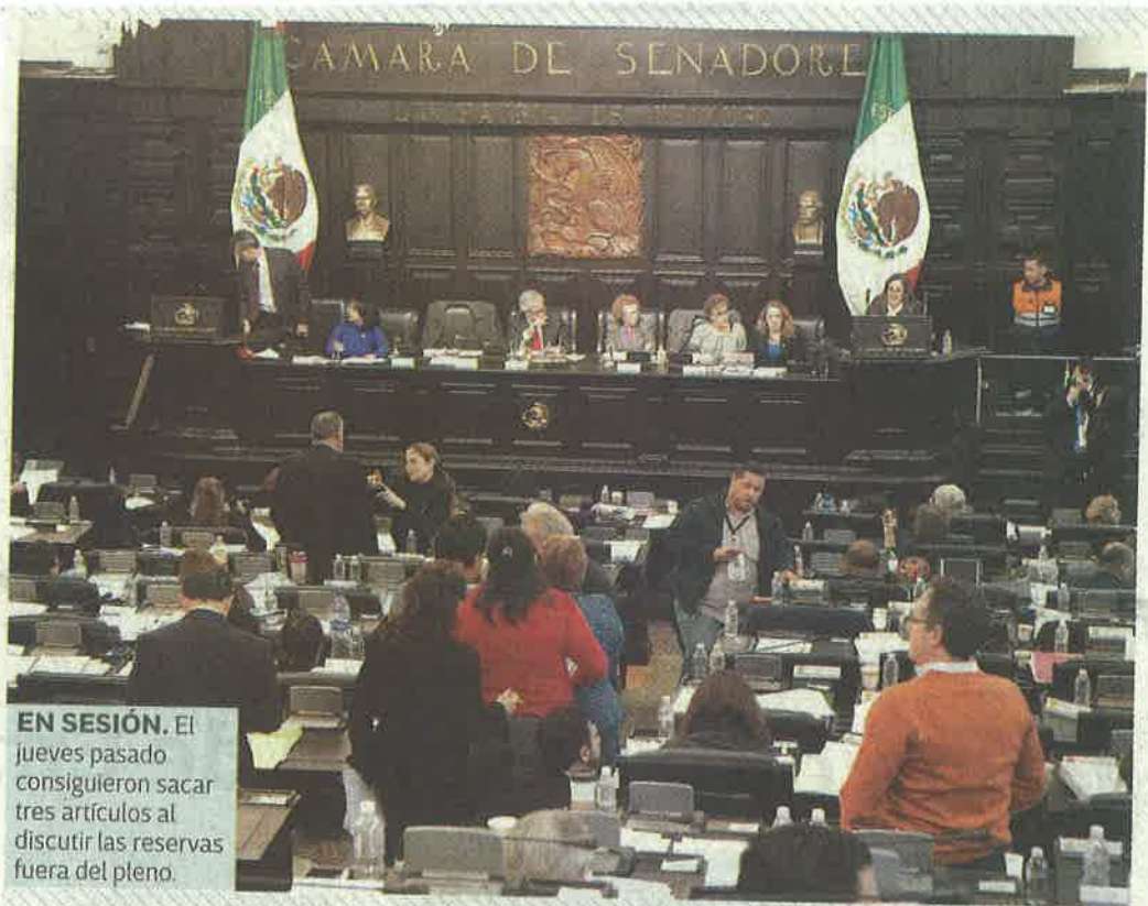
EN SESIÓN. El jueves pasado consiguieron sacar tres artículos al discutir las reservas fuera del pleno.

Destacó que el problema de origen es que cuando el poder legislativo federal aprobó la reforma política de la Ciudad de México, no previeron la complejidad del texto que propuso el jefe de gobierno, "ni la necesidad de una deliberación amplia sobre los temas".