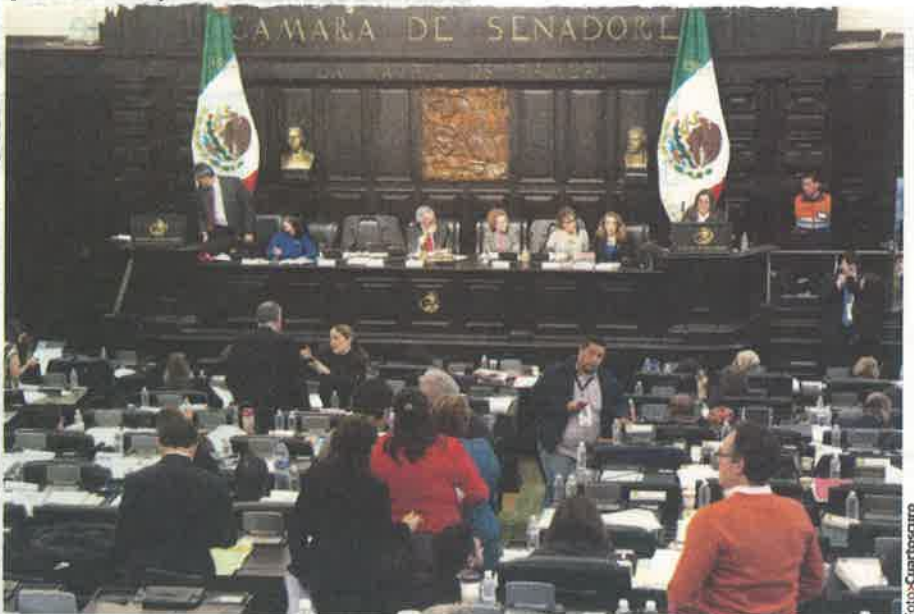
LOS ASAMBLEÍSTAS constituyentes, en sesión el pasado 10 de enero.

Reconoció que "algunos de los partidos minoritarios en la Asamblea han asumido un papel más serio al afrontar las incoherencias de la izquierda mal llamada progresista".