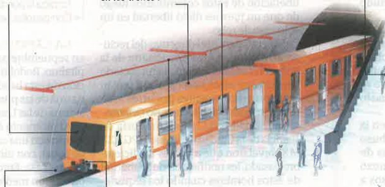
Gráfico: Daniel Martínez / La Razón

En el caso de la Línea 12 no se brindará WiFi debido a que podría interferir con el pilotaje.