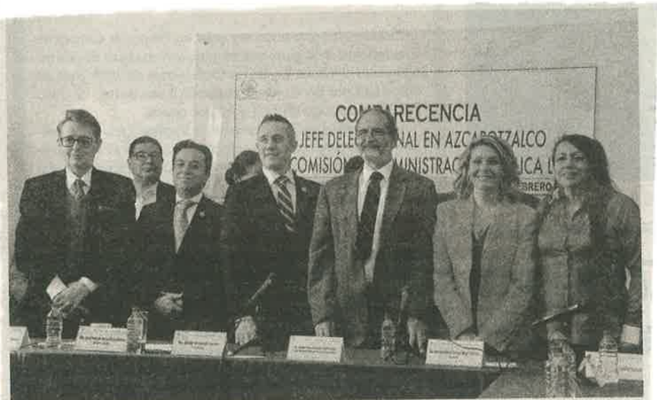
Moctezuma es cuestionado en torno a asignación de recursos para Azcapotzalco.

"Atendemos problemas urgentes de fugas de agua y drenaje, tubería deteriorada; mantenimiento a escuelas, implementación de programa de cosecha de agua de lluvias, rehabilitación de museos", entre otras acciones, concluyó.