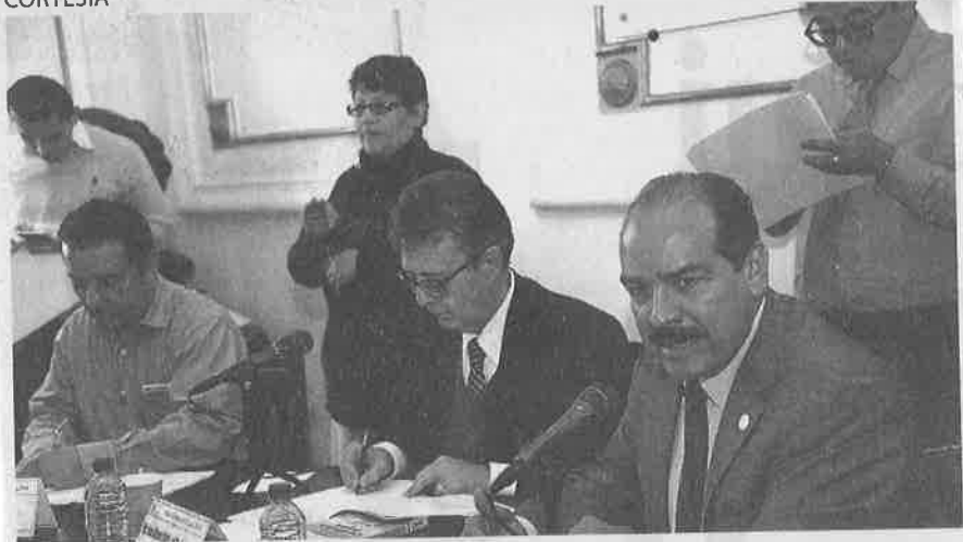
EL EQUIPO de trabajo de la Asamblea Legislativa del Distrito Federal en el tema ayer informó de los avances.

equipo es dar seguimiento al punto de acuerdo, aprobado recientemente por la Diputación Permanente de la ALDF, mediante el cual se exhortó a la Cámara de Diputados y al Senado de la República incluir a este órgano legislativo en lo referente al análisis y discusión de las leyes de Capitalidad y Metropolitana, así como incluir a representantes de la Asamblea en el Consejo Metropolitano.