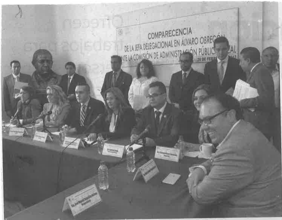
➤ Comparecencia ante la Comisión de Administración Pública de la ALDF.