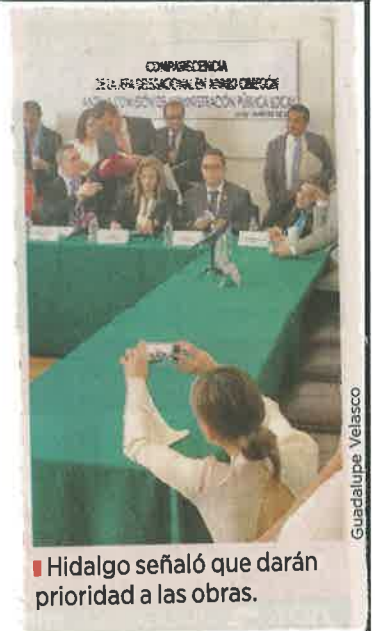
Hidalgo señaló que darán prioridad a las obras.

Ante ello, señaló que realizarán reuniones permanentes con habitantes y la Procuraduría de Justicia como complemento a las 254 cámaras y 574 alarmas vecinales instaladas en 2016.