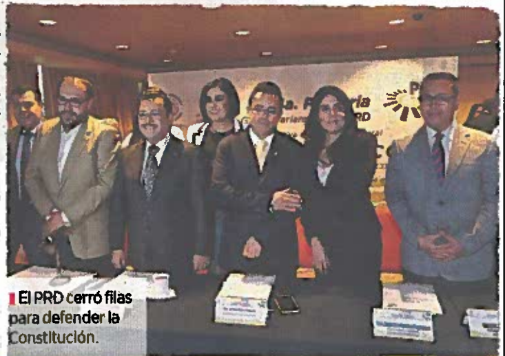
El PRD cerró filas para defender la Constitución.

El dirigente local Martí Batres, señaló que la impugnación de la Procuraduría pretende anular todo el título segundo de la Constitución.