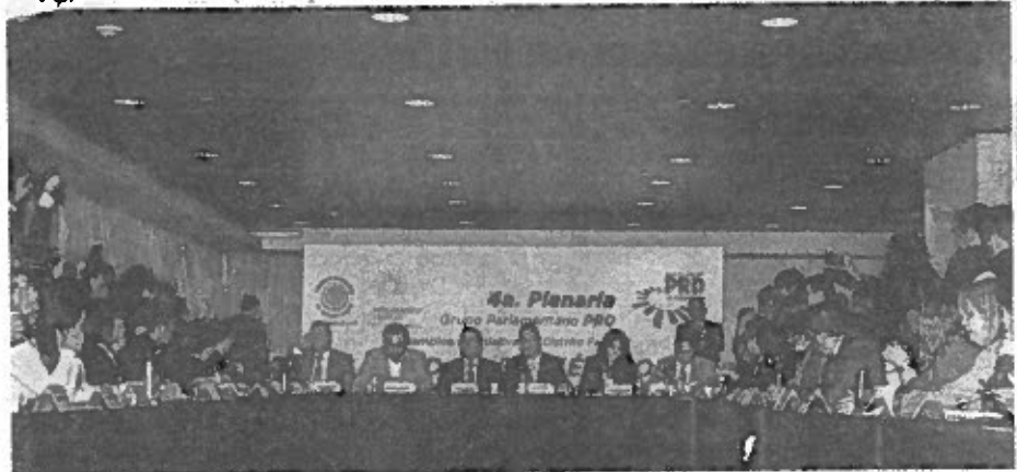
La fracción parlamentaria del PRD en la ALDF construirá leyes secundarias que ratifiquen a la ciudad como una entidad progresista y libertaria.

...tó, "todos los partidos políticos asumieron la Constitución como un logro y ahora la impugnan, situación que genera desconfianza en la clase política, hay que hacer de la responsabilidad y la congruencia nuestras armas, armonizando lo que se hace con lo que se piensa para sacar adelante los retos".