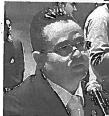
Presenta agenda de trabajo del PRD

claro que la capital no puede detener su desarrollo, pero, dijo, éste debe de ser equilibrado.