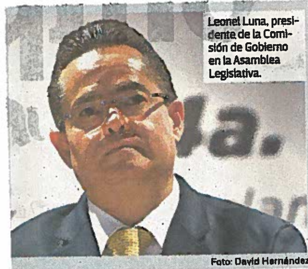
Leonel Luna, presidente de la Comisión de Gobierno en la Asamblea Legislativa.