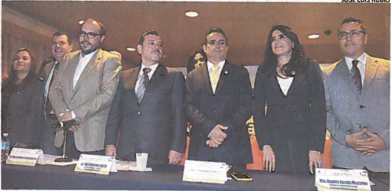
INAUGURACIÓN DE la Cuarta Reunión Plenaria de la fracción perredista de la Asamblea Legislativa del Distrito Federal.