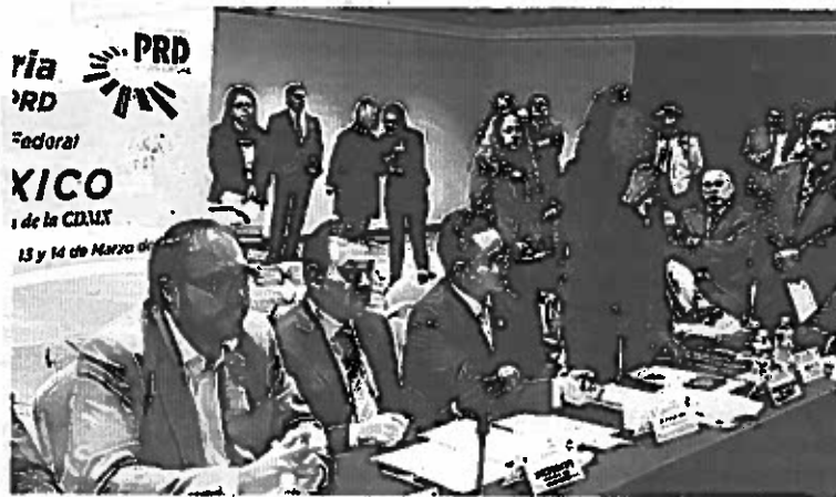
Defenderán Carta Magna

Asimismo, diputadas y diputados del PRD, líderes partidistas e integrantes del Gabinete del Gobierno de la Ciudad impulsarán un frente amplio para defender la Constitución, con todos los medios jurídicos y legales necesarios. (3)