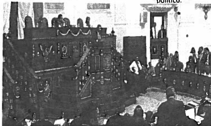
Asamblea Legislativa del Distrito Federal. Positivos consensos

Tiene que ver por primera vez con la interrelación de todo el sistema de transporte, dando seguridad a los usuarios, hacerlos accesibles al abordaje, cómodos, y de acceso facilitado para la población discapacitada. Como concesión sin la erogación de recursos públicos no tiene afanes privatizadores. Se define este modelo como de asociación público-privada que sirve para producir satisfactorios con bienes y servicios para la población aprovechando la colaboración con el sector privado del país. No es de ninguna manera una privatización a menos que no exista un modelo de economía mixta. En fin, el proyecto a dos años de su terminación, que no inaugurará Mancera, ni es privatizador ni tiene lucro político.