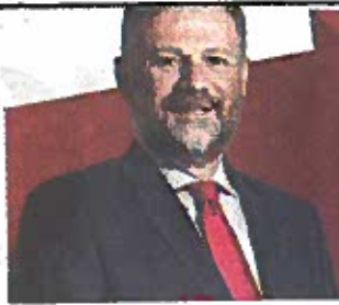
Juegos de poder LEO ZUCKERMANN leo.zupinar.com.mx