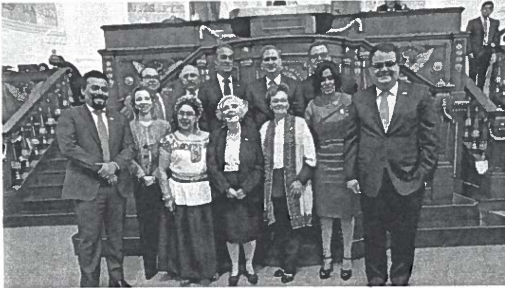
El GP de México dejó cifras impresionantes MéxicoGP

México empieza a exigir a Checo Arranca la preventa para el Gran Premio de México