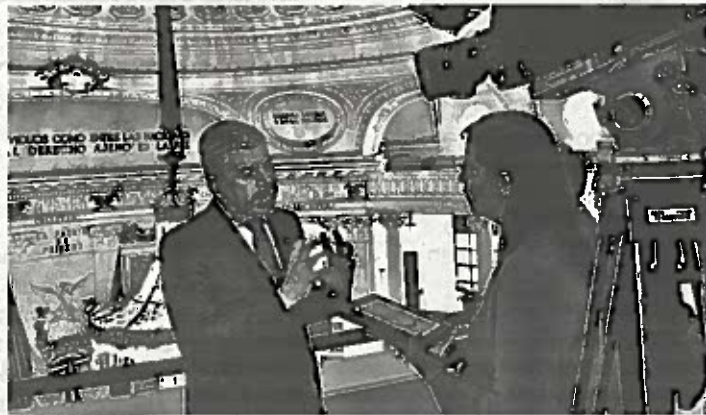
Asegura que se pueden tener dos cargos

El perredista indicó que el escándalo que se ha armado por el departamento de Miami de un millón de dólares que Barrales Magdalena posee y no declaró en su “tres de tres”, forma parte de una campaña de desprestigio, que atenta contra una mujer exitosa y luchadora. □