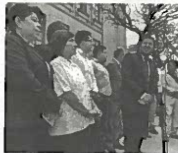
Acudieron a la SCJN

"Vamos a solicitar formalmente ser escuchados y participar como terceros interesados en este proceso que hará la Su-