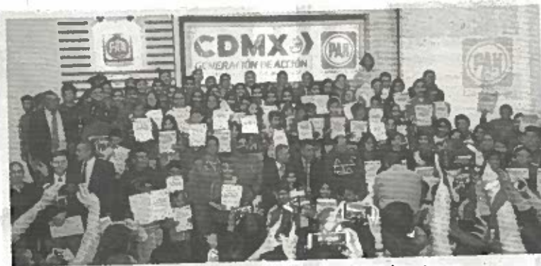
Diputados y asambleístas reconocen a los mejores 100 karatecas de la Ciudad de México

"Día tras día surgen más y mejores talentos que no debemos dejar perder, por lo que los invito a apoyarlos para encaminarlos al éxito y puedan más adelante representar dignamente a nuestro país, que hoy más que nunca requiere de mexicanos de talento que pongan en alto su nombre a nivel internacional. Démosles las herramientas, que ellos sabrán bien qué hacer con ellas", culminó.