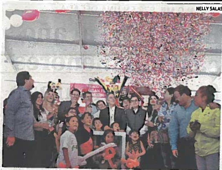
El mandatario local encabezó el festival de la niñez en el Zócalo.