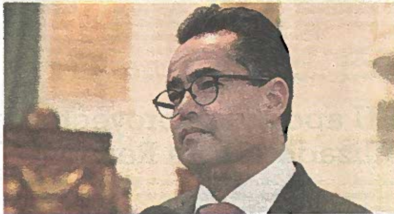
Contará con nuevas facultades y obligaciones.

En relación a la composición del Congreso, se integrará por 66 diputaciones; la mitad designada por el voto directo y la otra mitad por la vía del principio de representación proporcional, sistema de representación mixto tutelado en la Constitución Política de los Estados Unidos Mexicanos. Lo anterior favorece a una configuración más plural del Congreso, consideró.