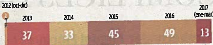
Estados con más casos (2012-2017)