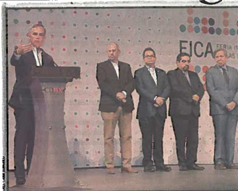
Miguel Angel Mancera. Falta mucho por hacer.