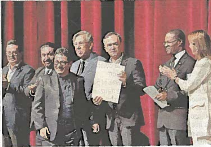
Mancera encabezó la inauguración de la novena edición del foro.