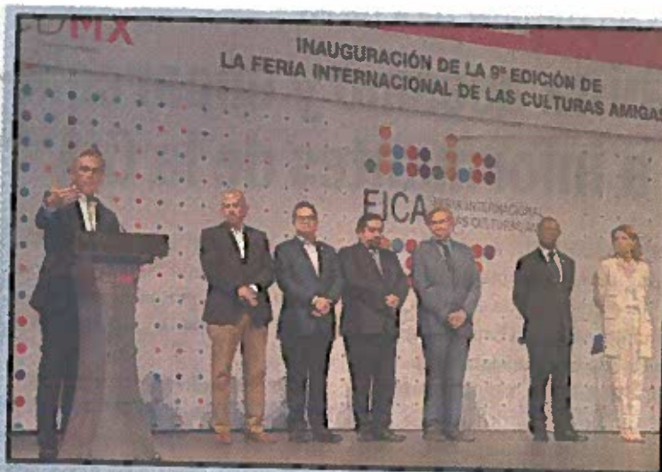
Inaugura Miguel Angel Mancera, jefe de Gobierno capitalino, la FICA.