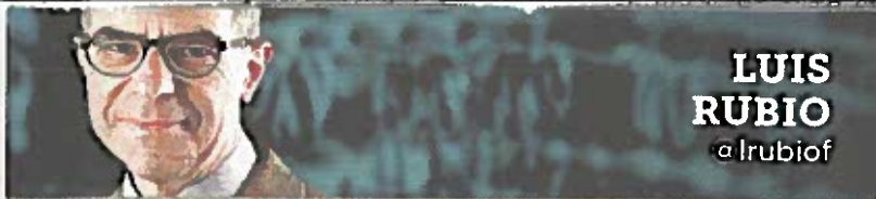
LUIS RUBIO @lrubiof

El país no ha progresado por los intereses que, como los huachicoleros, impiden el desarrollo y sustentan la promesa de retorno al pasado.