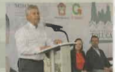
DAVID PENCHYNA, INFONAVIT El 31 de marzo acudió a la Feria de la Vivienda en Toluca.