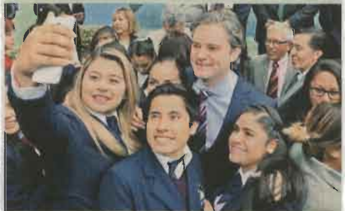
AURELIO NUÑO, SEP El 16 de febrero participó en el ciclo de conferencias "Lo normal es la ciencia" en Cuautitlán Izcalli.