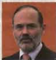
Gustavo Madero Expresidente del PAN

La unión entre ambos partidos se ha registrado en estos estados.