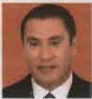
Rafael Moreno Valle Exgobernador de Puebla