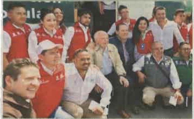
JOSÉ NARRO, SSA El 5 de marzo 2017 encabezó en Ecatepec una jornada médica en la que atendió a pacientes de manera personal.

Algunos de los funcionarios federales y las regiones asignadas en el Edomex en veda electoral: