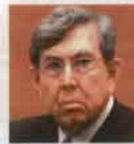
Cuauhtémoc Cárdenas Experredista y fundador

un frente amplio, que significa una conjunción de los opositores del PRI para 2018; es decir, a todos los partidos de izquierda, organizaciones civiles..."