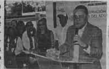
Habrán talleres y convivencia

trabajar etcétera y nuestros adultos mayores se encuentran solos en casa todo el día, por supuesto que esto provoca depresión", afirmó el delegado.