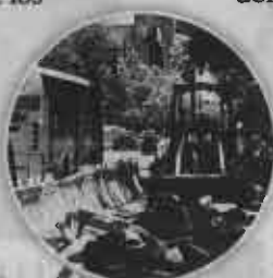
Que sí, pero...

Va bien, dijo, "se está haciendo llegar al juzgador toda la documentación y yo espero que pronto tengamos una resolución que despeje cualquier sombra de duda".