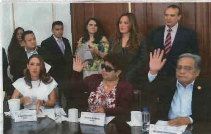
ASAMBLEISTAS al aprobar modificaciones a la Ley de Residuos local, ayer.

A su vez, el Artículo 344 destaca las penas de 9 años y hasta 5 mil unidades de cuenta, "a quien deposite más de un metro cúbico de residuos sólidos en un lugar no autorizado".