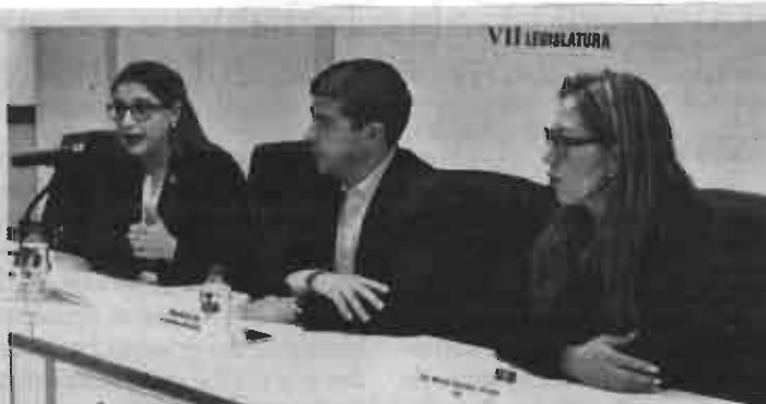
Que se está gastando una lanota, denunciaron

ocasionan gastos financieros innecesarios, les da armas a sus enemigos políticos y termina cediendo por no socializar el proyecto de movilidad".