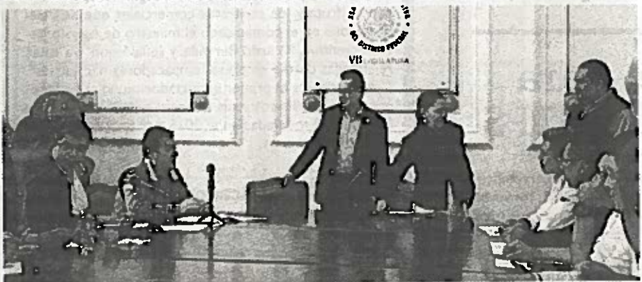
A revisión la norma 024 de separación de residuos sólidos.

Subrayó "aquí lo que vemos es que se quiere privatizar y monopolizar el servicio, tal y como lo ha hecho en Morelos, Graco Ramírez Garrido Abreu, al igual que muchos gobernantes que están utilizando todo el poder para esto, la verdad es que nosotros los verdaderos delincuentes que si trabajamos, nos aplican todo el peso de la ley, por lo que vemos con decepción que a los verdaderos maleantes no tal y como es el caso de Javier Duarte de Ochoa".