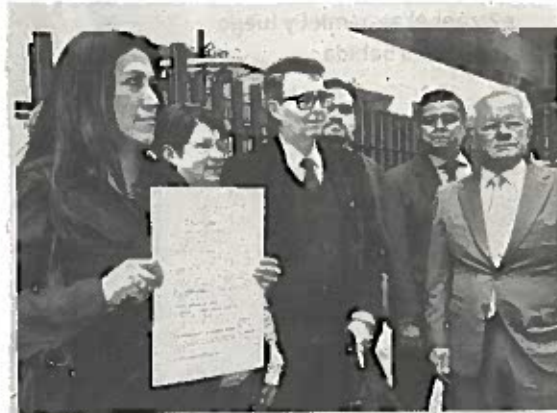
Los vecinos aseguran que el nuevo Programa no tomó en cuenta a los barrios originarios.