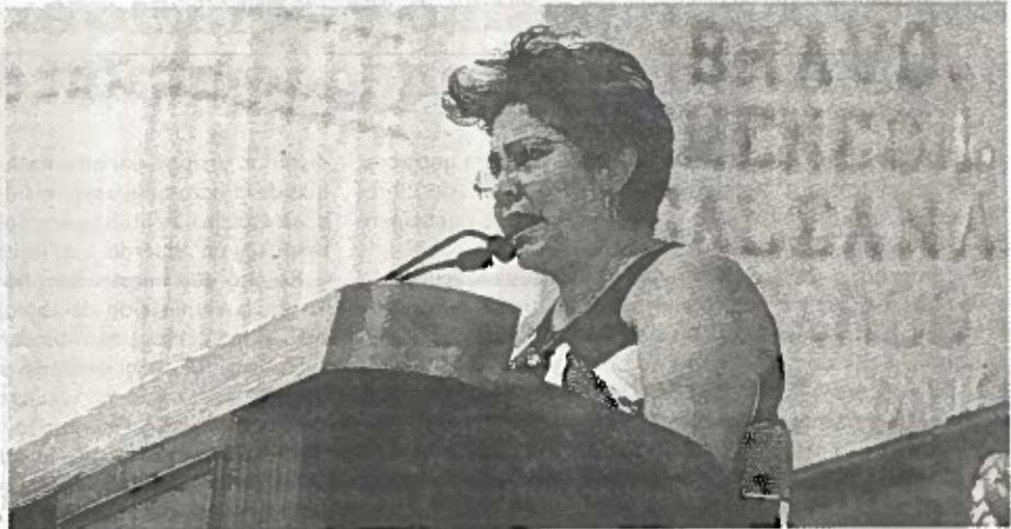
El propósito es implementar medidas para disminuir las emisiones de bióxido de carbono y reducir los efectos de éste.

En Benito Juárez sustituirá y concluirá las obras de drenaje profundo para reducir 6 mil 624 toneladas de bióxido de carbono al año.