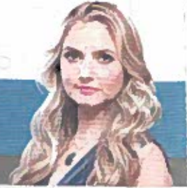
Por Ángeles Aguilar