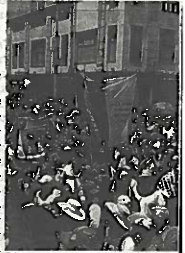
Fueron recibidos por el diputado Leonel Luna