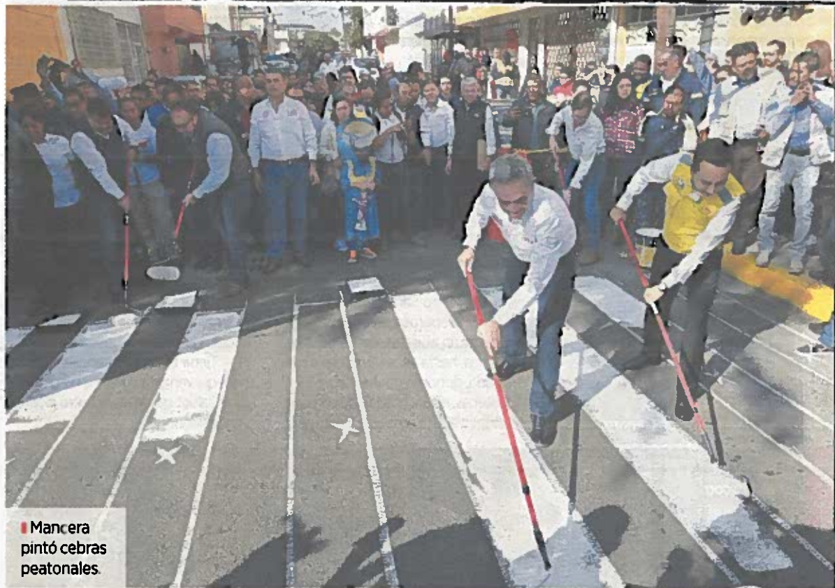
■ Mancera pintó cebras peatonales.