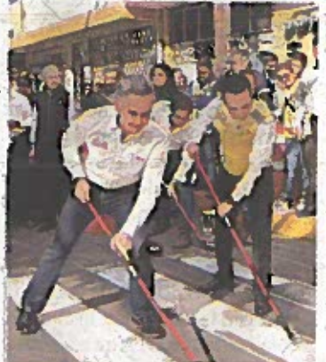
El jefe de Gobierno y el diputado.

marcación. Tuve la oportunidad de ser legislador con otros jefes de Gobierno, uno asistió en cuatro ocasiones, otro en tres", apuntó. M