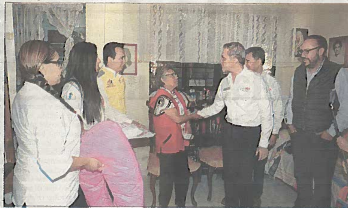
En el marco de la jornada sabatina de "Tu Ciudad Te-Require", el jefe de gobierno de la Ciudad de México, Miguel Ángel Mancera Espinosa, anunció la ampliación de la Línea 5 del Metrobús. Asimismo, informó sobre el operativo en Tlalpan, donde hubo nueve establecimientos mercantiles suspendidos por violaciones administrativas, tres de ellos con indicios de narcomenudeo.