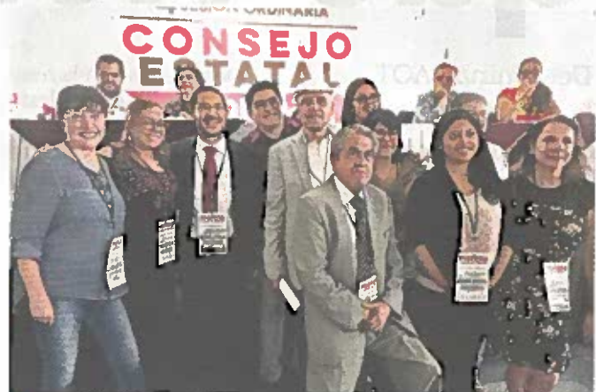
■ Durante el Consejo local, los morenistas eligieron un máximo de tres aspirantes para las candidaturas de 2018.

La próxima semana discutirán con este método a los candidatos para los diputados de distritos locales y federales en la Ciudad.