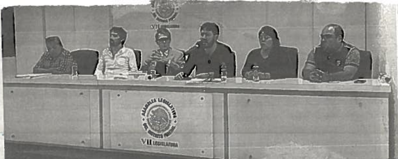
■ Suárez del Real apoya a propietarios afectados

fueron clausurados por la administración mancerista; uno ubicado sobre la calle de Donceles y cinco sobre la calle de Cuba