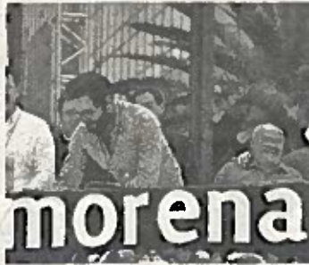
Perredistas les niegan apoyo