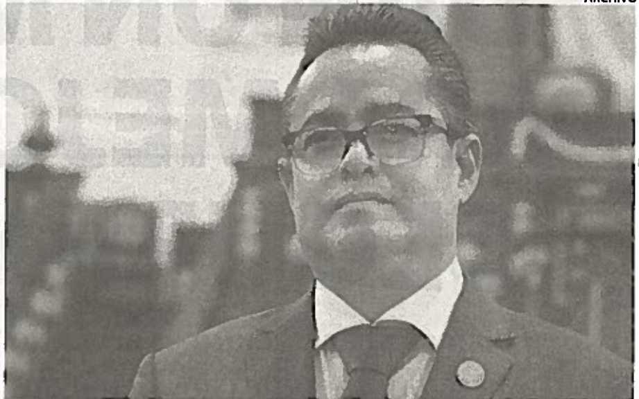
LA INICIATIVA del diputado Leonel Luna derogará el Reglamento Interior de la Administración Pública.

La Asamblea Legislativa apura las iniciativas para las leyes secundarias que proceden de la recién creada Constitución de la Ciudad de México, las cuales deberán estar aprobadas a más tardar el 31 de diciembre de este año.