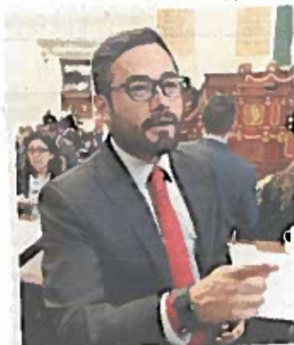
■ El diputado acusó a la Jefa Delegacional por daño moral.

mita a realizar afirmaciones sin sustento alguno o conclusiones no demostradas, no puede considerarse un verdadero razonamiento y, por ende, debe calificarse como inoperante”, es la respuesta del Tribunal.