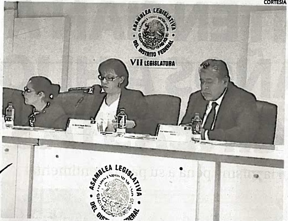
DIPUTADOS DE Morena plantearon la pena mínima de 20 años contra este delito

De aprobarse, se incrementarían las penas al feminicida, la mínima de 20 años a 40 años, y la máxima de 50 a 60 años. Además, "si el asesino mantuvo con la víctima una relación sentimental, afectiva o de confianza;