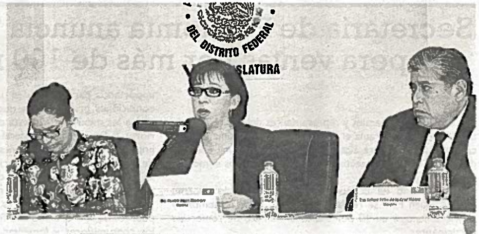
Sólo 36 % del total de asesinatos de mujeres registradas en la CDMX se investigan como feminicidios, el resto como simples homicidios o suicidios.

Aseveró, "esta iniciativa no sólo busca castigar al feminicida, sino también a los servidores públicos pues las muertes violentas de mujeres son responsabilidad del Estado, un Estado que hasta la fecha, tolera los cada vez más alarmantes, casos de asesinatos de mujeres en la ciudad, tal como el que sucedió en Lindavista, en la delegación Gustavo A. Madero, donde una joven fue encontrada muerta en el closet de su pareja, quien hasta la fecha se encuentra en libertad".