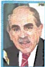
PABLO GÓMEZ • Fundador del PRD. Ex integrante del Movimiento Estudiantil de 1968. Tiene 28 años de militancia.

ÉSTOS SON LOS PERREDISTAS QUE SE HAN VUELTO INNOMBRABLES ENTRE LA MILITANCIA DEL SOL AZTECA. PESE A SU HISTORIA Y APORTACIÓN AL PARTIDO, AHORA LOS QUIEREN ECHAR POR APOYAR EL PROYECTO DE ANDRÉS MANUEL LÓPEZ OBRADOR.