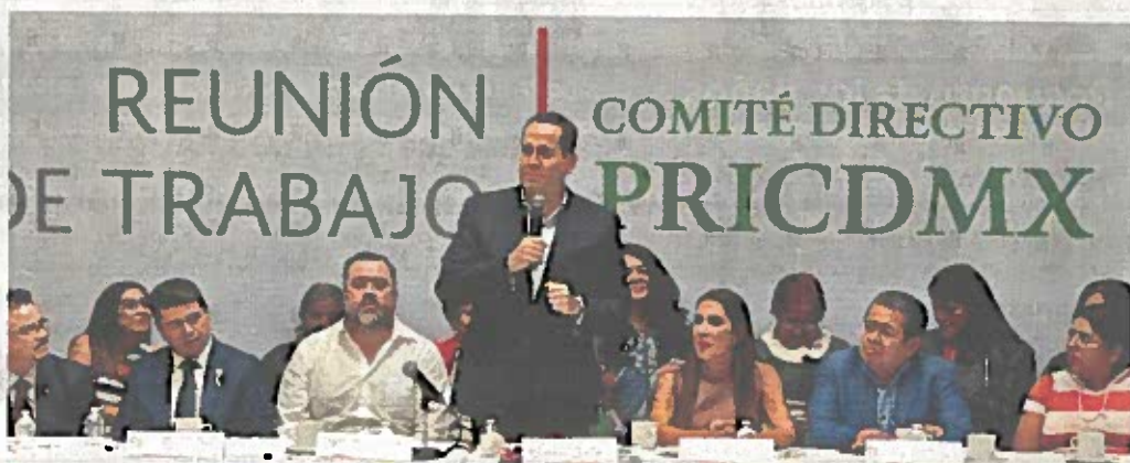
■ Ayer, el ex Gobernador tuvo su primera reunión con el Comité Directivo del tricolor capitalino.

Sin embargo, dijo, también es un castigo para las mujeres de la Ciudad, que, explicó, lo asocian con los feminicidios en la región, lo que le resta en lugar de sumarle al tricolor capitalino.