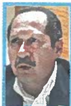
LEONEL GODOY • Fundador del PRD. Ex gobernador de Michoacán. Ex presidente nacional. Militó 28 años en el PRD.