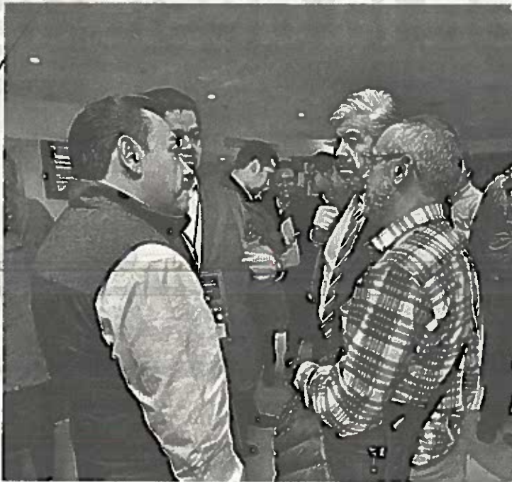
La designación, un castigo también para priístas

"Estaré buscándolo (a Monreal) en próximos días para hacerle una invitación formal.