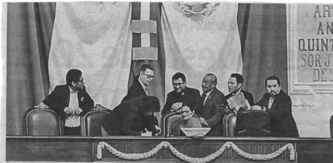
Se hace grande el pleito entre las dos bancadas de izquierda

La legisladora acudió al Instituto de la Mujer a presentar denuncia contra los tres diputados perredistas, por discriminación.