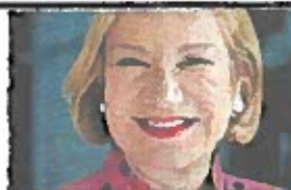
GUADALUPE LOAEZA gloaezatovar@yahoo.com

En "la tierra que el sol mejor alumbra" la grilla y los libros reunieron a amigos de antaño.