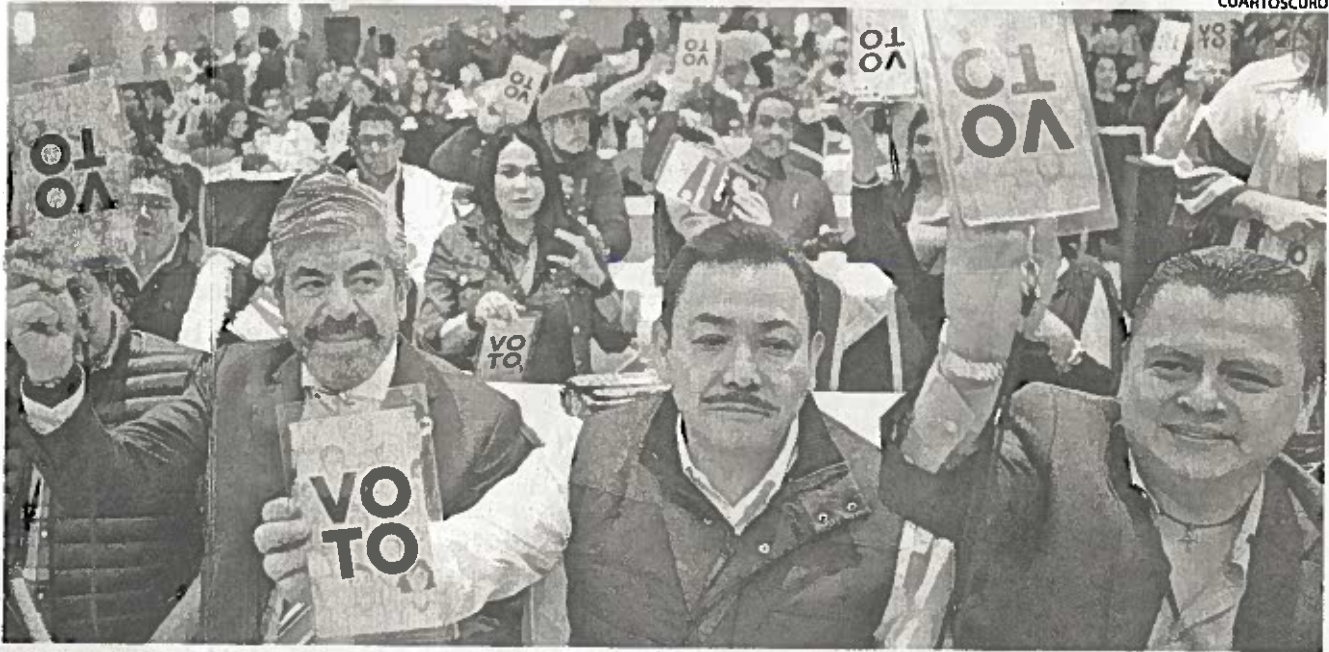
EL PRD sumó 21 millones de aportaciones partidarias, que fue 4% de sus ingresos