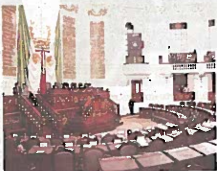
ALDF. La sesión está programada a las 9:00 horas; morenistas llegarían antes al recinto.

“Cuando respetas la normativa, el procedimiento legislativo fluye. En esta oca-