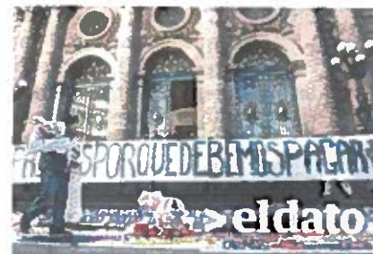
EL PASADO 16 de noviembre damnificados del 19-S se manifestaron afuera de la ALDF en contra de la Ley de Reconstrucción.

Créditos que llegan a otorgar apoyos hasta por 4 millones de pesos, además de que cuentan con una bolsa que puede alcanzar hasta 13 millones de pesos.