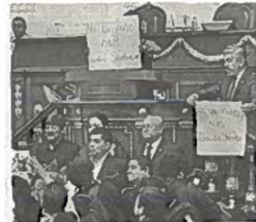
Dicen que no trabajan