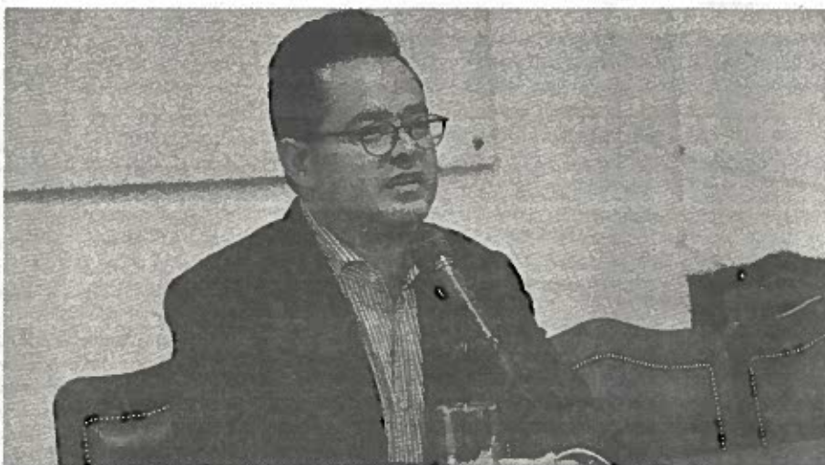
Hay un doble discurso, con intención política y electoral para aprovecharse de los damnificados

Hizo un llamado al partido de Morena para que se conduzcan con seriedad, responsabilidad y asuman su compromiso con los habitantes de la Ciudad de México, particularmente con los afectados del sismo del pasado 19 de septiembre.