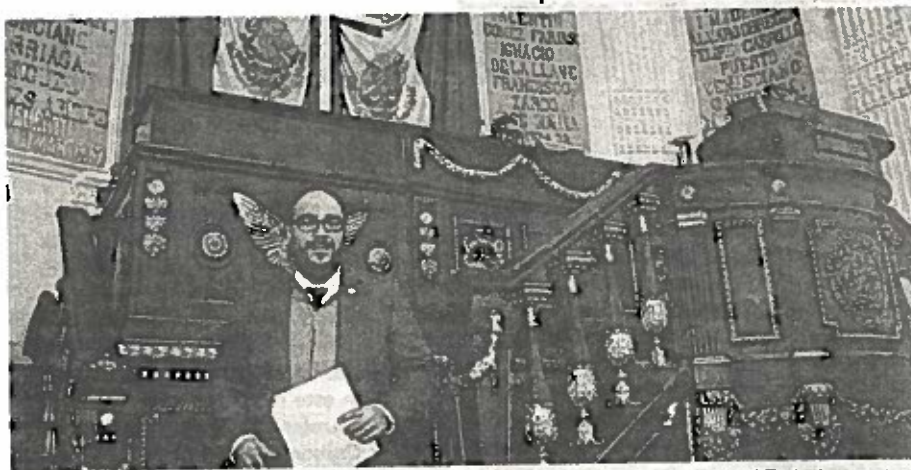
En la CDMX 32 mil 240 personas tienen problemas de audición y 5 mil 887 de lenguaje.

Adelantó que propondrá un apartado especial en el presupuesto del ejercicio fiscal del 2018 para la construcción de la primera escuela para sordos en la CDMX.