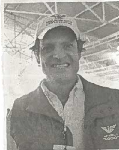
ARMANDO LÓPEZ Campa pide ampliar el presupuesto de CdMx para atender desastres naturales