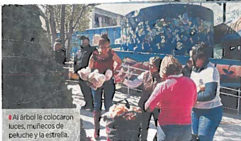
■ Al árbol le colocaron luces, muñecos de peluche y la estrella.

De acuerdo con la Subsecretaría, este tipo de actividades forman parte del proceso reinserción.