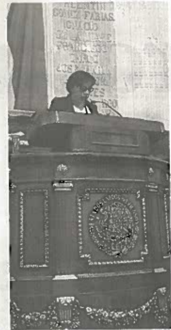
AYER SOLO se sesionó por tres horas y media