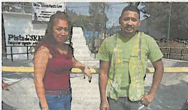
La presidenta de la Comisión de Reclusorios recordó que hay muchos presidiarios que necesitan apoyo para no reincidir.