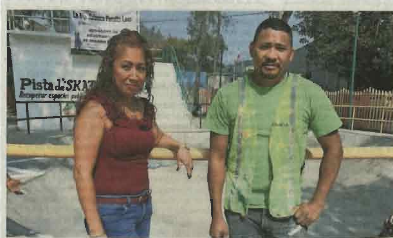
La presidenta de la Comisión de Reclusorios recordó que hay muchos presidiarios que necesitan apoyo para no reincidir.