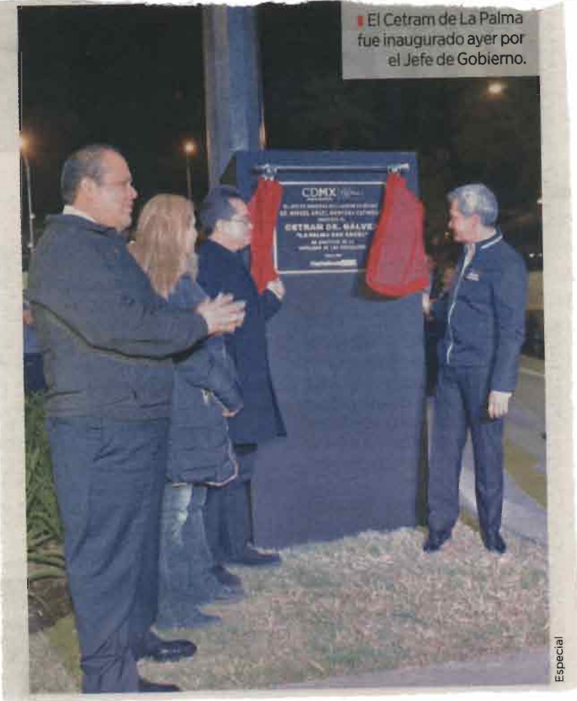
El Cetram de La Palma fue inaugurado ayer por el Jefe de Gobierno.