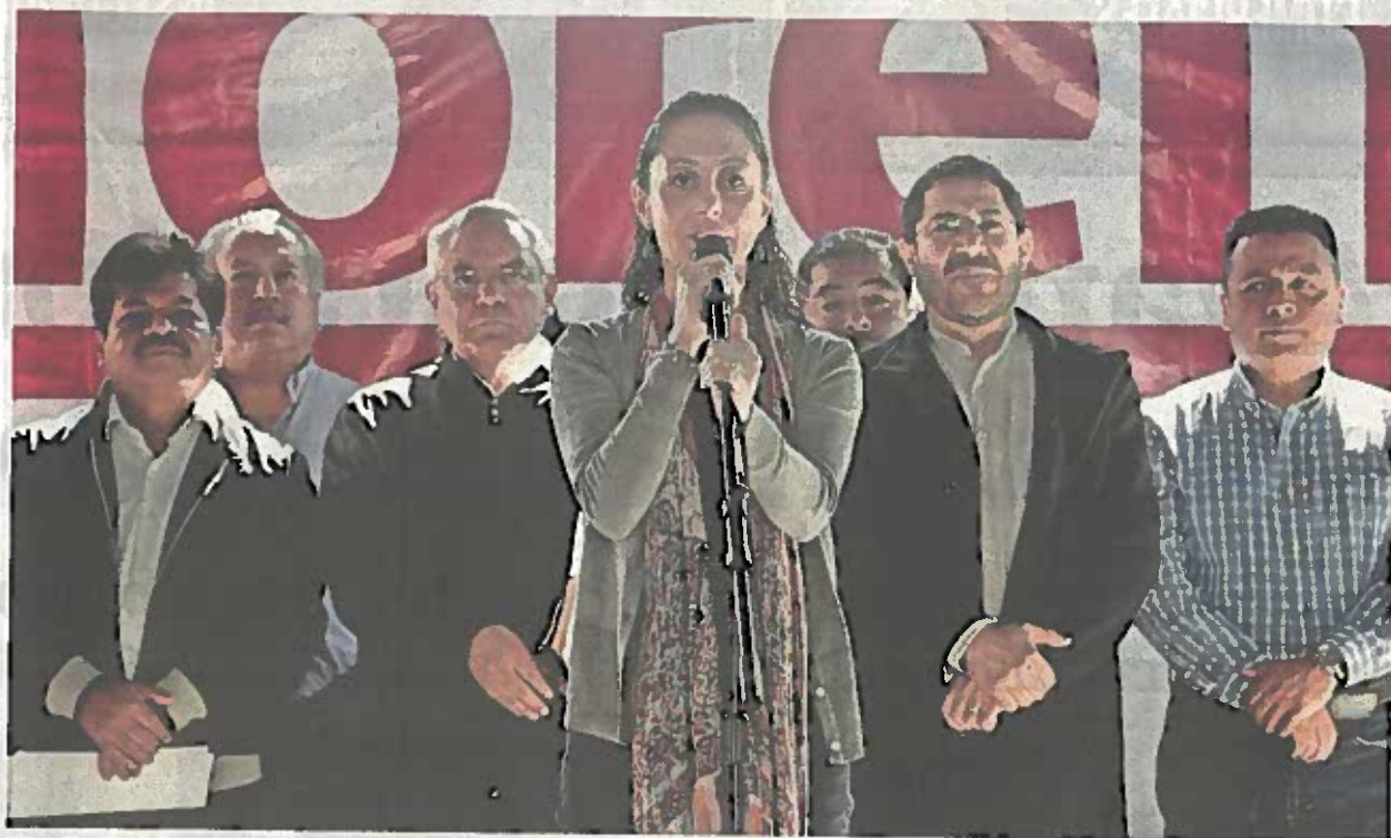
Claudia Sheinbaum Pardo (centro) reprobó que el gobierno de la Ciudad de México traiga gente de otros países para hacer estudios de ingeniería, cuando hay universidades públicas en el país que han ayudado en el tema luego del sismo.