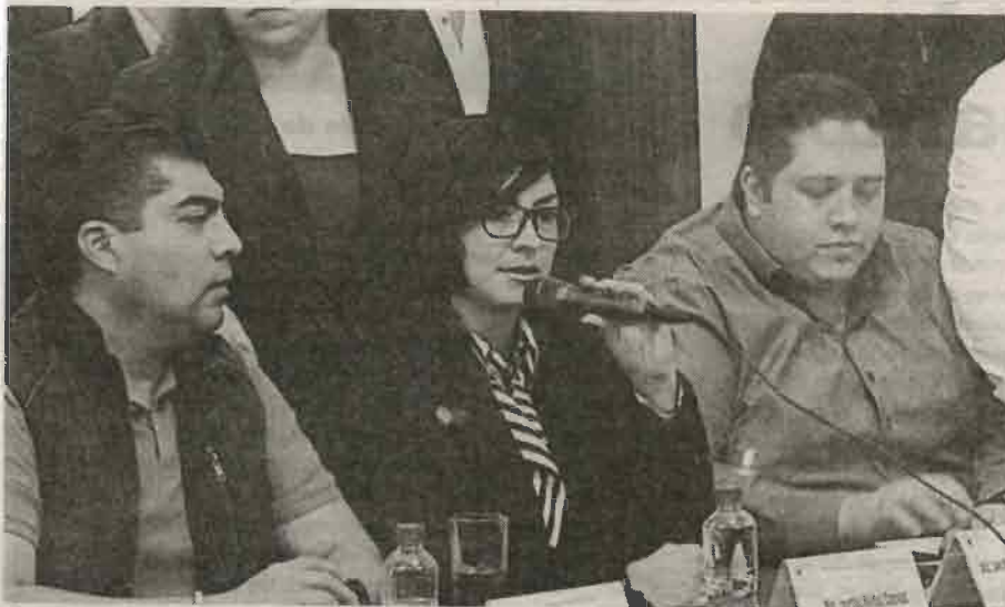
Se debe dotar de mayores servicios e inversión a los albergues públicos de la Ciudad de México.

Dijo que ha recibido a liderazgos locales, con quienes ha establecido un plan de trabajo que coadyuve a fortalecer los servicios públicos, en especial en esta temporada de frío, "por ello requerimos la participación activa de las empresas y su solidaridad para atender a los grupos vulnerables que se refugian en la ciudad". Solicitó a los empresarios locales de Tlalpan ser consientes, y donar comida, ropa y medicamentos básicos a los albergues de la zona.