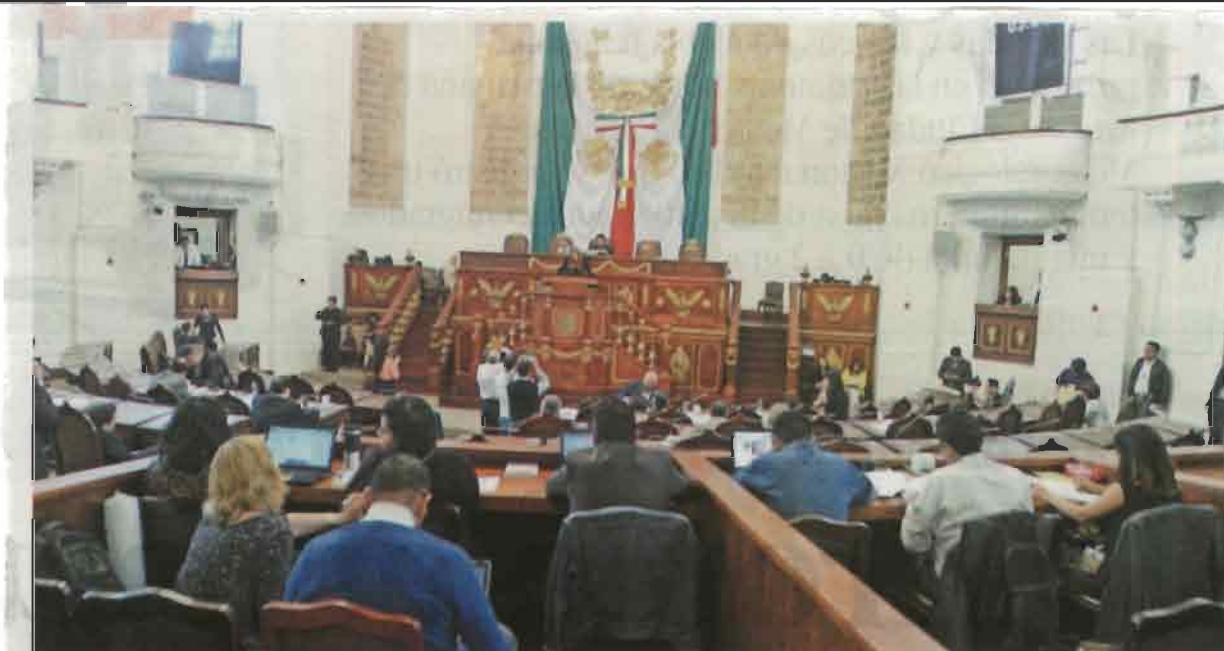
Los diputados han aplazado desde junio pasado la aprobación del Sistema Local Anticorrupción