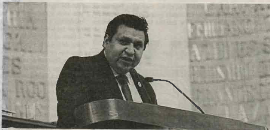
La sociedad participa con la transferencia de sus conocimientos.

Aseguró, "la voz ciudadana es eje sustancial para delimitar decisiones", por lo que la Comisión de Transparencia realizará foros y encuentros vecinales, académicos y políticos para profundizar los temas que refieren los nombramientos anticorrupción.