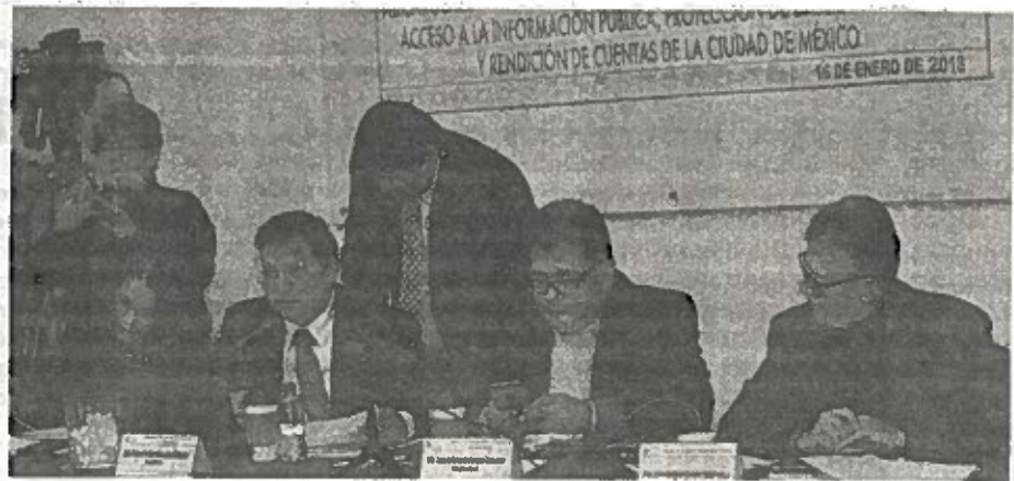
De los 67 aspirantes los diputados deberán elegir siete perfiles.

Las entrevistas continuarán los días 17 y 18 de enero como parte del proceso de selección y posteriormente la comisión dictaminará la propuesta que será presentada ante el Pleno de la ALDF.