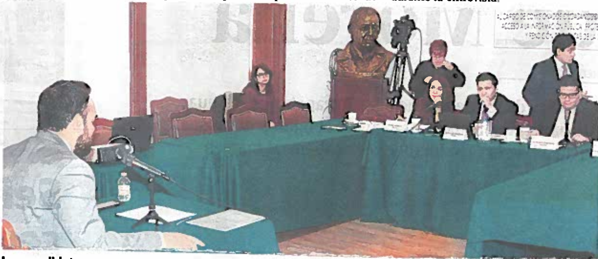
Los candidatos se presentaron ayer en la ALDF para ser calificados

Cada uno de los asambleístas evalúa la formación académica, experiencia laboral, independencia política, compromiso con el combate a la corrupción, transparencia y rendición de cuentas, estudios de posgrado, ética e integridad y desempeño durante la entrevista.