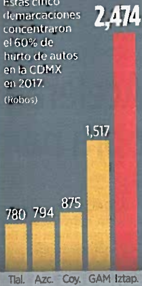
Tlal. Azc. Coy. GAM Iztap.