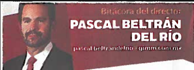
Bitácora del director: PASCAL BELTRÁN DEL RÍO pascal.beltrandelrio@qum.com.mx