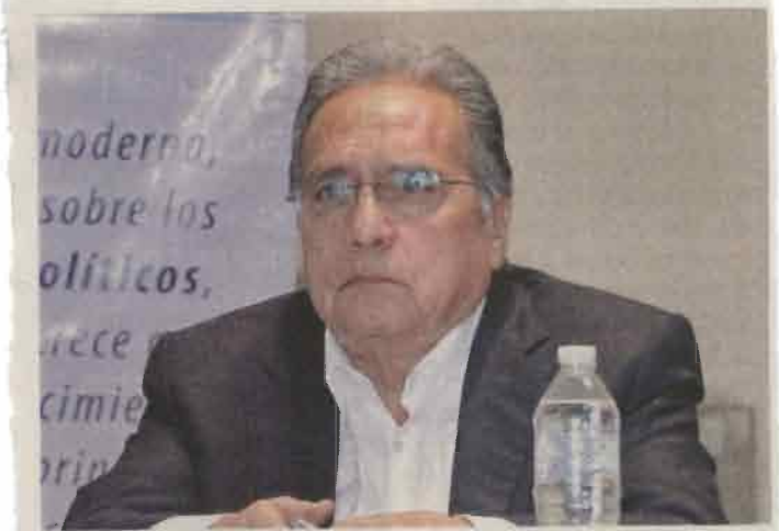
El diputado local, del Partido Humanista, viajaba en la Línea 2 del STC, a la altura de Bellas Artes, al momento del atraco.

Cifras de la Procuraduría capitalina indican que, de enero a octubre del año pasado, se iniciaron mil 670 denuncias por robo en el Metro, mientras que en el mismo lapso de 2016 hubo un total de 738.