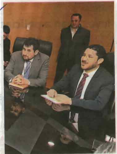
Los representantes de Morena en diálogo con autoridades del IECM

Opinó que resulta incomprensible que mientras siete de los 10 partidos se han comportado de manera comprometida, Morena sea tratado de manera diferente e individual para tratar asuntos que corresponden a todos por igual.