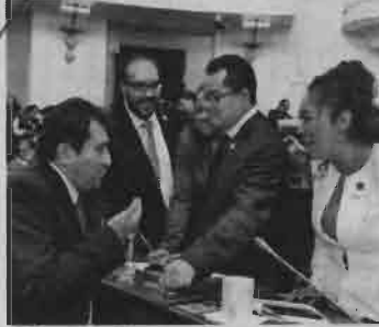
■ Por gobierno incluyente

Parlamentario del PRD en la ALDF destacó que hay seis temas fundamentales que se deben tomar en cuenta: Combate a la inseguridad, la corrupción y la impunidad; respeto al marco institucional; gobiernos de-