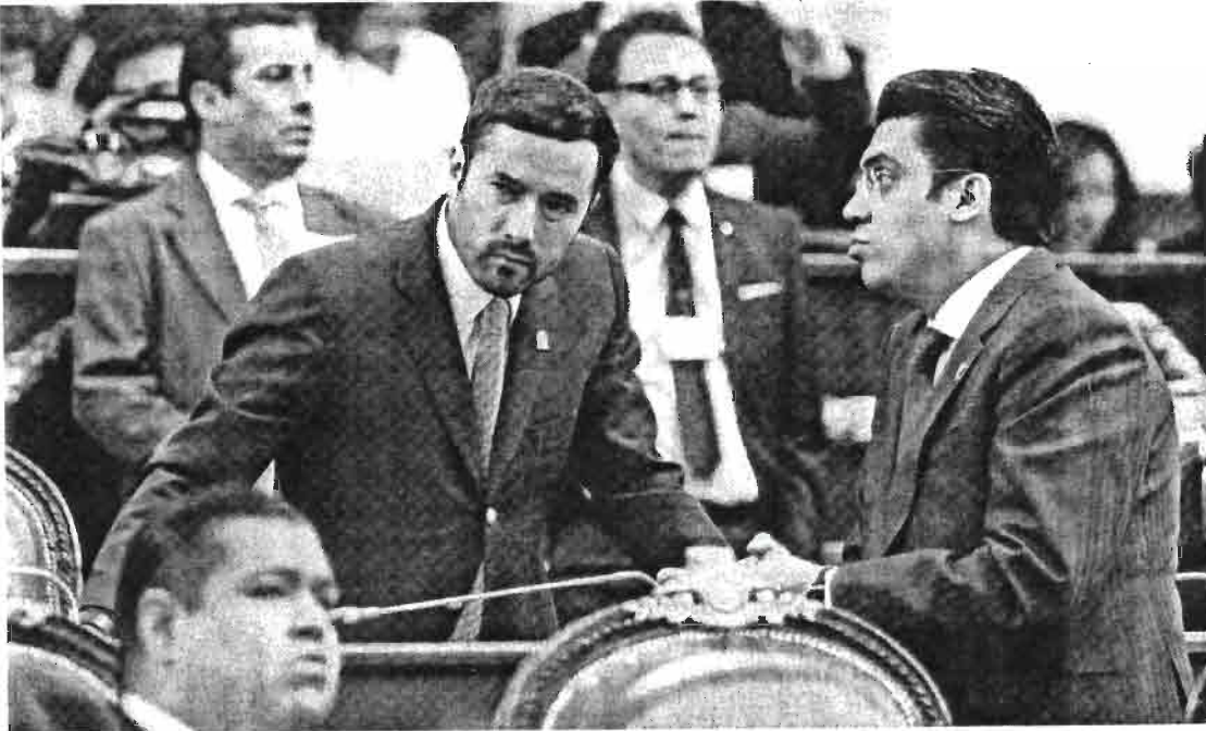
☛ DUDA. El virtual candidato de Morena a Miguel Hidalgo reconoce su rivalidad con Xóchitl Gálvez.