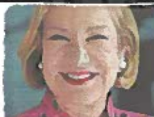
GUADALUPE LOAEZA gloaezatovar@yahoo.com

Acostumbrada a las críticas y descalificaciones, Alejandra Barrales ha salido adelante desde niña gracias a su tenacidad.